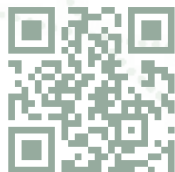
Formations en présentiel

Pour prendre connaissance de notre catalogue de formations CPF, veuillez scanner le QR code :